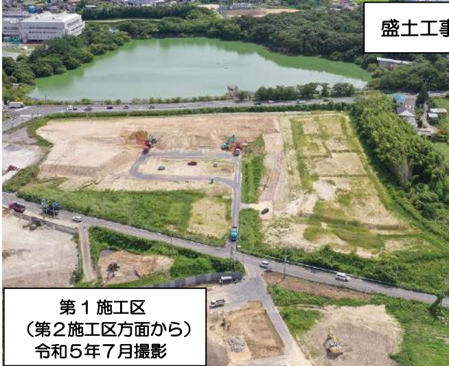
第1施工区 (第2施工区方面から) 令和5年7月撮影