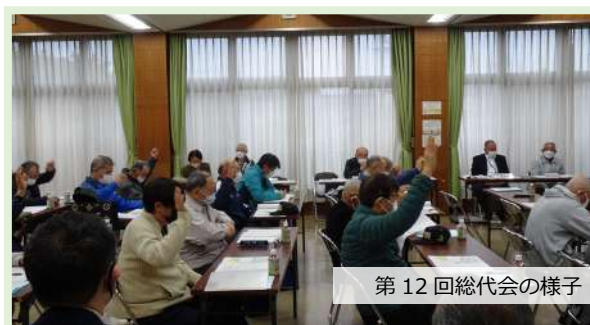
第12回総代会の様子