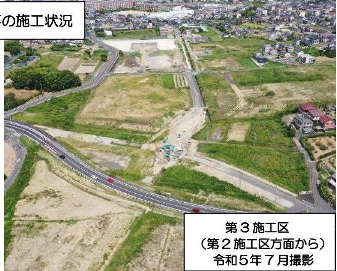
第3施工区 (第2施工区方面から) 令和5年7月撮影